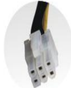
6 pin PCI-e Connector x1