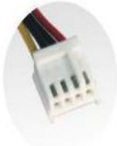
4 pin Floppy Connectors x2