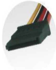
S-ATA Connectors x3