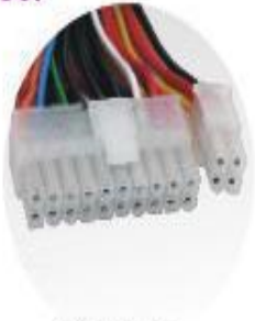
20+4 pin Motherboard Connector x1