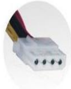
4 pin Peripheral Connectors x6

2. Desenchufe todos los conectores que salen de la fuente y alimentan a los distintos dispositivos como disco duro, CD ROM , tarjeta madre, disquetera, etc.