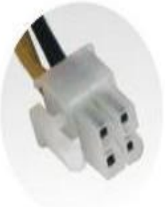
4 pin CPU +12V Connector x1